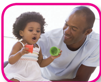
Talk to Me 24-36 months