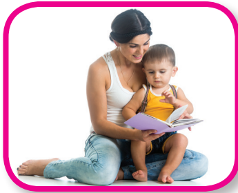
Read to Me 18-36 months