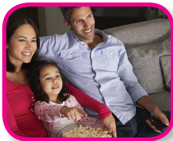
Watch TV with Me 24-36 months