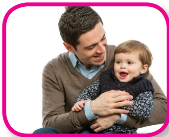
Listen to Me 18-36 months